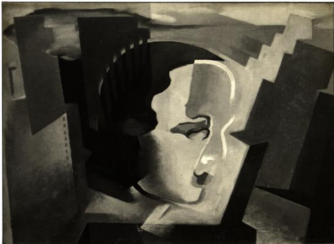
XVII. Esposizione Internazionale d'Arte di Venezia - (350) FOTO GIACOMELLI - VENEZIA Prampolini Enrico - PAESAGGIO FEMMINILE

Link risorsa: https://www.lombardiabeniculturali.it/fotografie/schede/IMM-3a010-0003265/