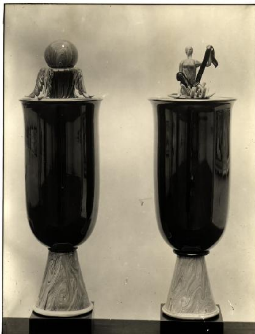
XVII Esposizione Internazionale d'Arte di Venezia N. 1044 ENAPI Roma Vasi in vetro soffiato Disegno Giov. Guerrini Esecuzione Ditta Venini Venezia