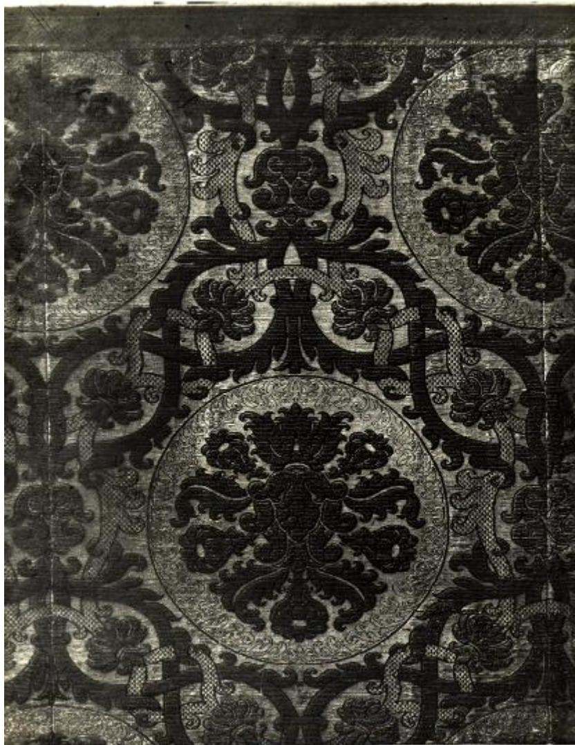
Museo Poldi-Pezzoli 5. Stoffa o paglia d'altare ricamata in oro e argento

Link risorsa: https://www.lombardiabeniculturali.it/fotografie/schede/IMM-3a010-0003408/