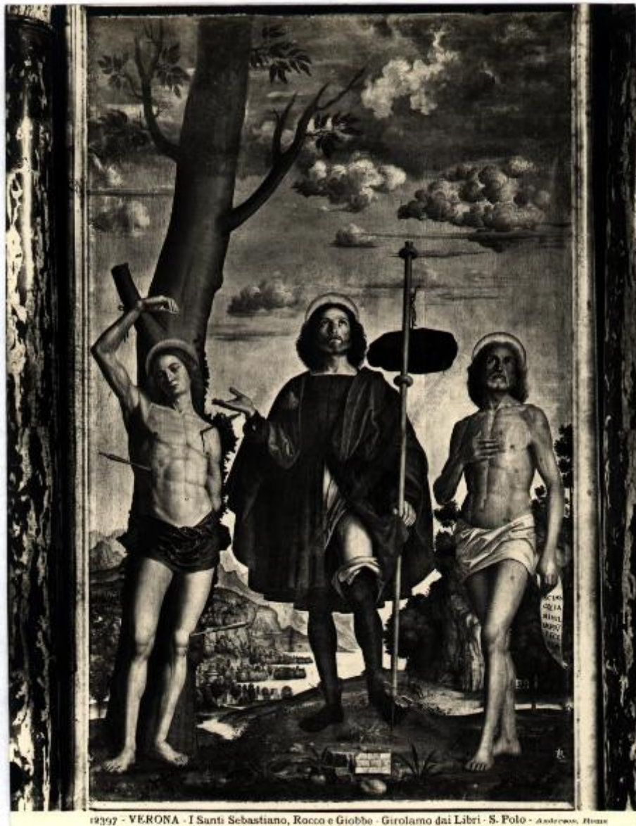
19397 - VERONA - I Santi Sebastiano, Rocco e Giobbe - Girolamo dai Libri - S. Polo - Antiquos, Roma