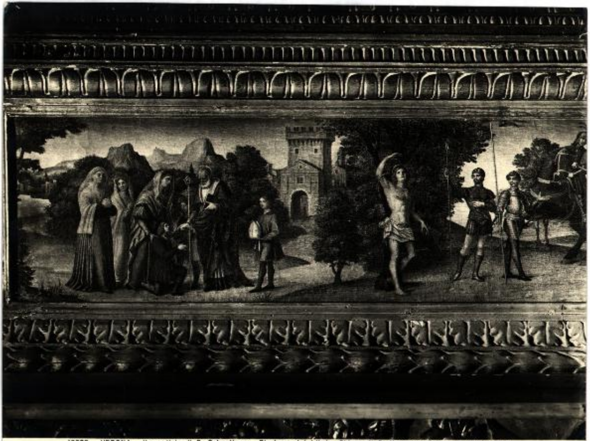
12389 - VERONA - Il martirio di S. Sebastiano - Girelamo dai Libri - Chiesa di S. Nazaro e Celso