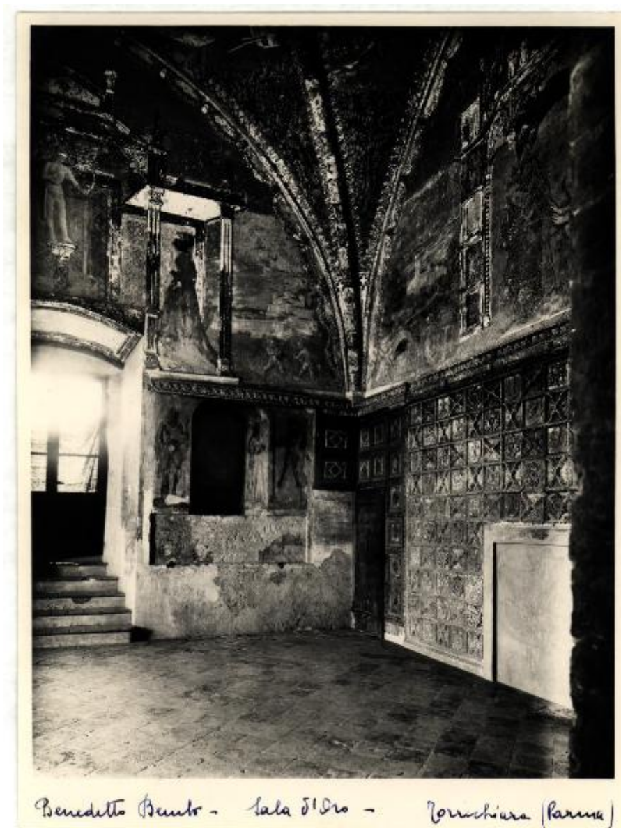
Benedetto Beato - Sala d'oro - Torriciana (Parma)