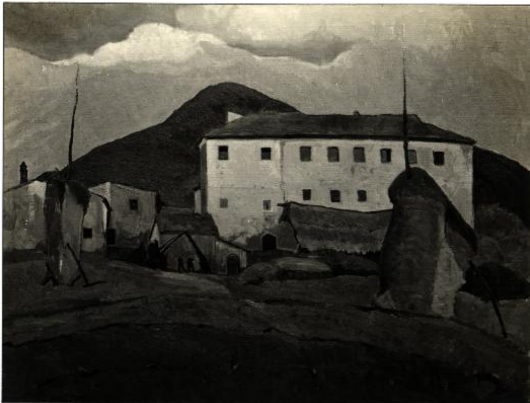
XVII. Esposizione Internazionale d'Arte di Venezia - Guzzi Beppe PAESAGGIO TOSCANO GRIGIO