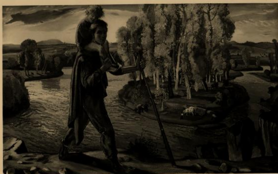
XVII Esposizione Internazionale d'Arte di Venezia