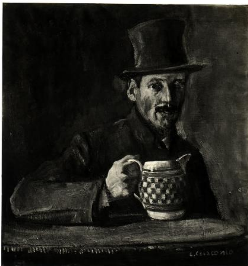
XVII, Esposizione Internazionale d'Arte di Venezia - Ciscanio Luigi - RITRATTO DI UOMO (31)

Link risorsa: https://www.lombardiabeniculturali.it/fotografie/schede/IMM-3a010-0003941/