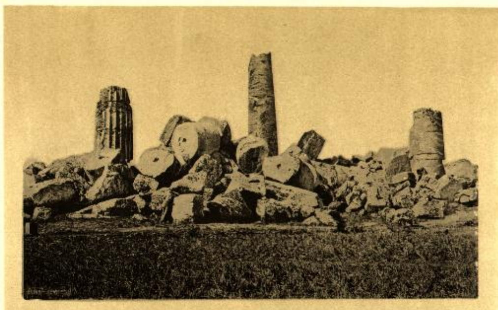
SELINUNTE TEMPIO D' APOLLO