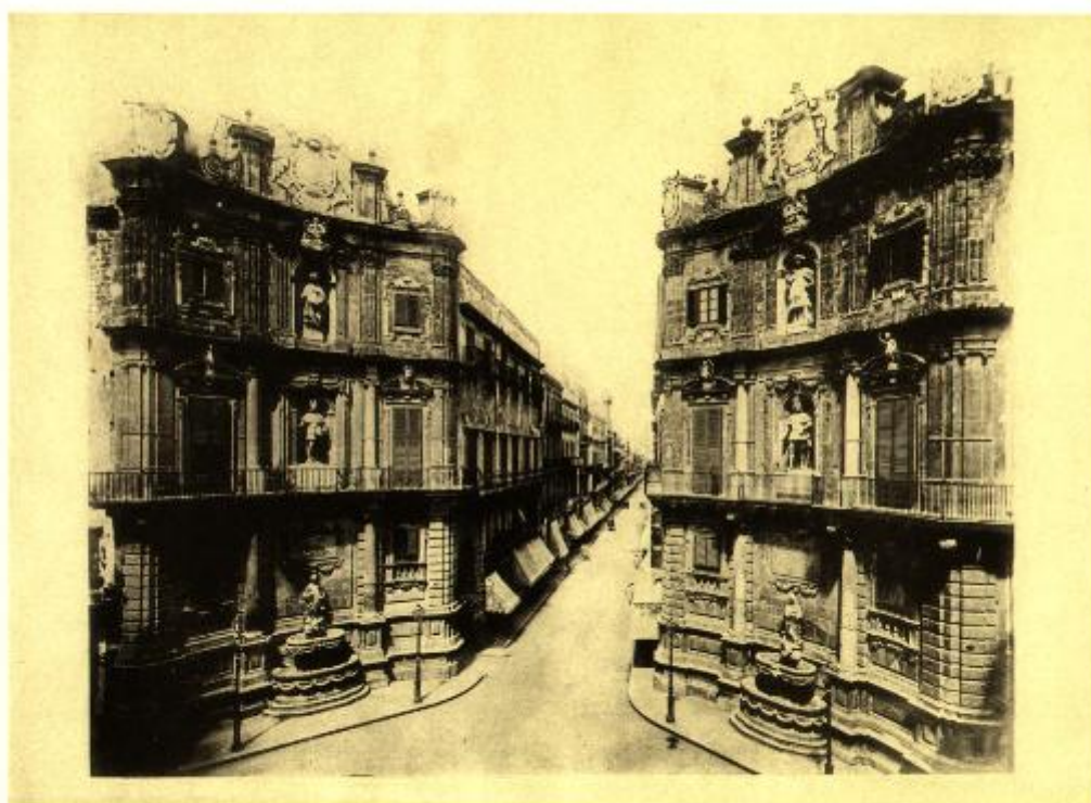
PALERMO - PIAZZA VIGLIENA