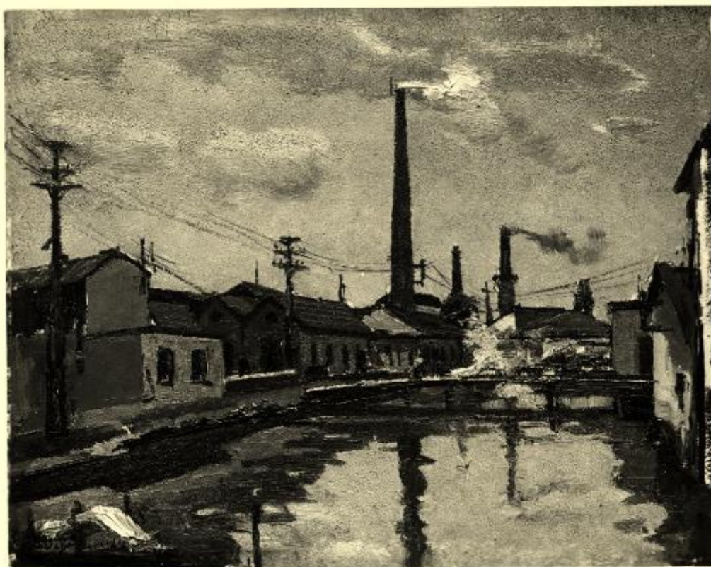
XVII Esposizione Internazionale d'Arte di Venezia