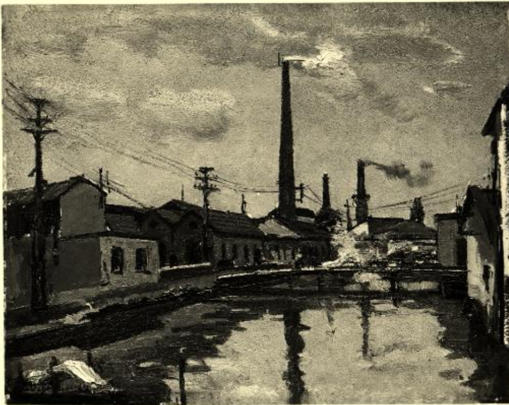
XVII Esposizione Internazionale d'Arte di Venezia