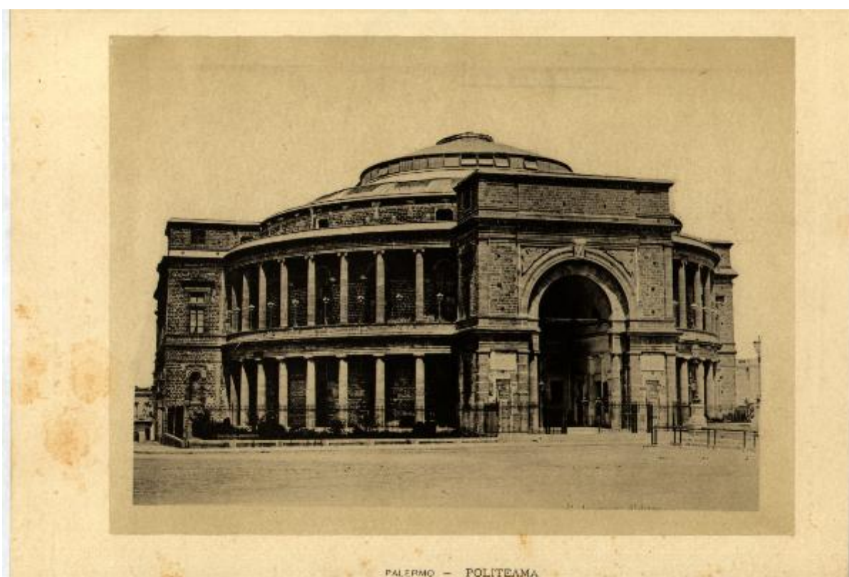
PALERMO - POLITEAMA