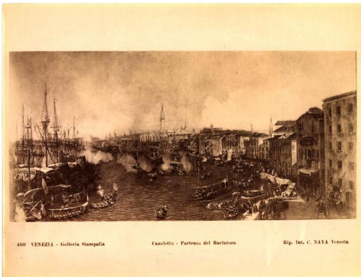
460 VENEZIA - Galleria Stampalia