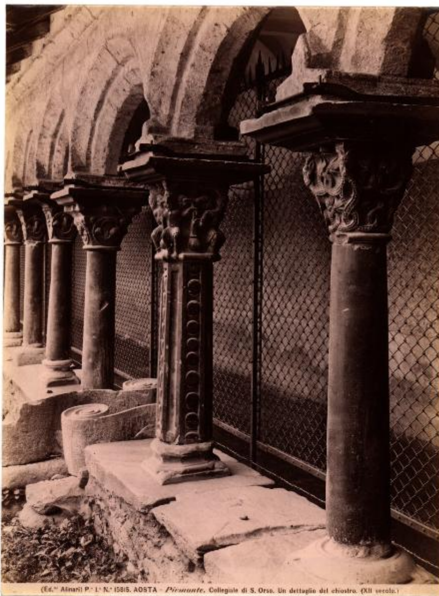
(Ed. A. Alinari) P. L. N. 15815. AOSTA - Piemonte . Collegiale di S. Orso. Un dettaglio del chiostro. (XII secolo.)