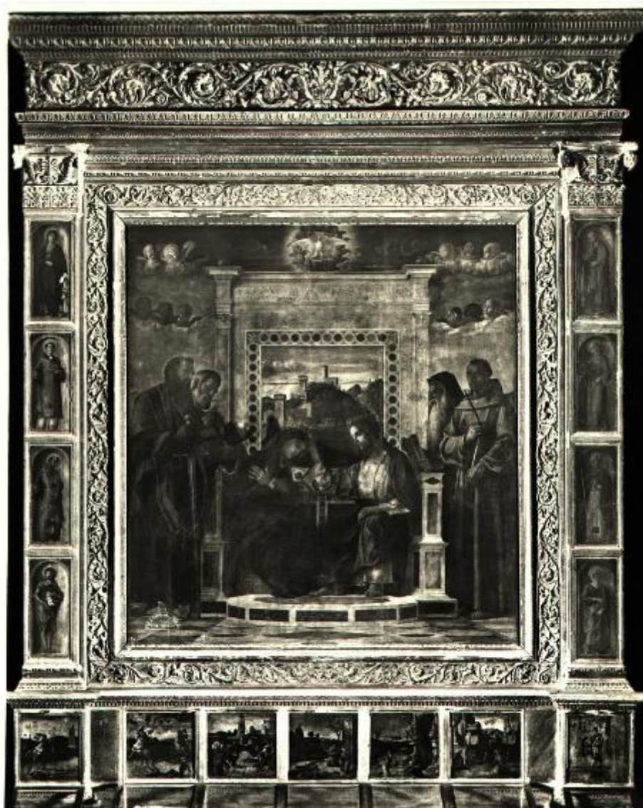
N.° 10075 Pesaro - Museo Civico. Incoronazione della Vergine e Santi. grande pala di Giov. Bellini. F.lli Alinari 1933