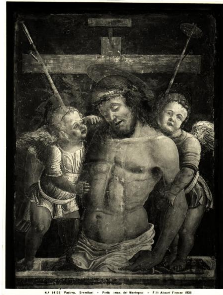
N.º 14155 Padova, Eremitani - Pietà (mas. del Mantegna) - F.lli Alinari Firenze 1930