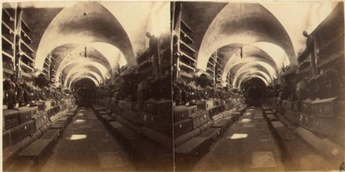
n° 46 bis morti conservate al convento dei capucini in Palermo.