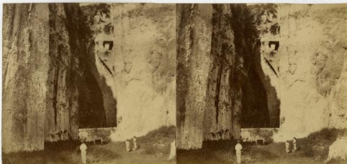
SICILIA N. 132. SIRACUSA L'orecchio di Dionisio