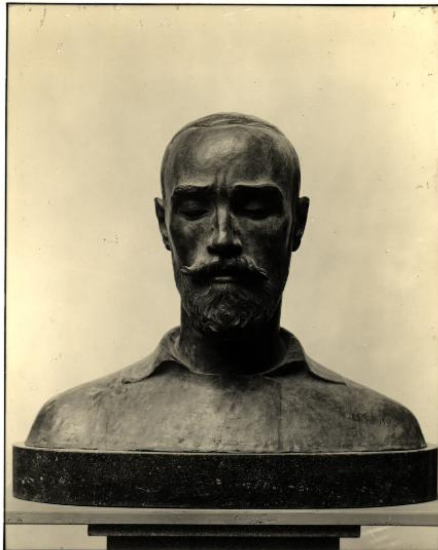
XVIII Esposizione Internazionale d'Arte di Venezia N. 480 D'Antino Nicola RITR. di F. PAOLO MICHETTI

Link risorsa: https://www.lombardiabeniculturali.it/fotografie/schede/IMM-3a010-0007140/