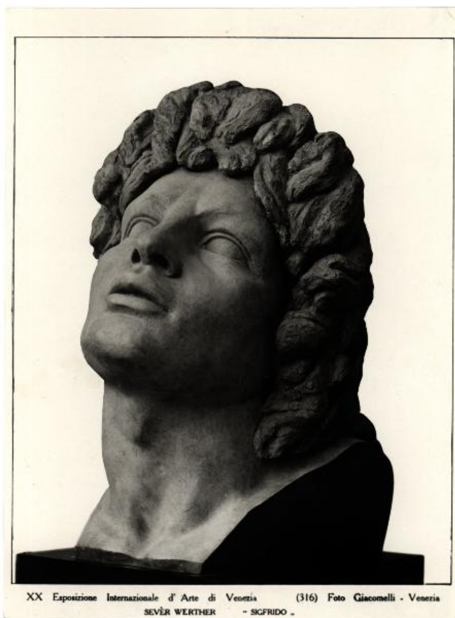
XX Esposizione Internazionale d'Arte di Venezia (316) SEVER WERTHER "SIGFRIDO"