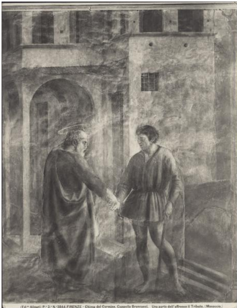
P. 2. N. 3844, FIRENZE - Chiesa del Carmine, Cappella Brancacci. Una parte dell'affresco il Tributo. (Masaccio.)