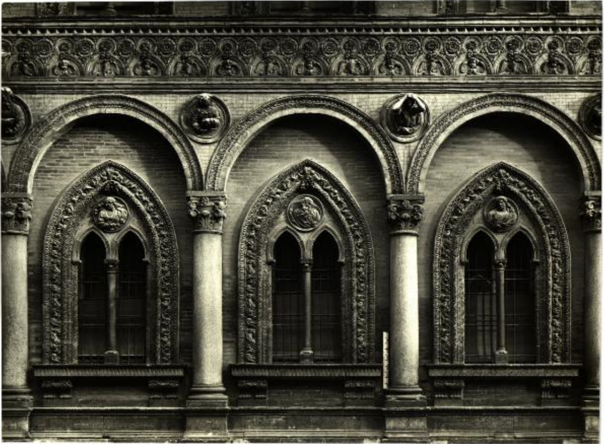
(Ed. Alinari. P. I. N.° 14266. MILANO - Ospedale Maggiore. Tre Finestre. (Antonio Averlino).

Link risorsa: https://www.lombardiabeniculturali.it/fotografie/schede/IMM-3a010-0009033/