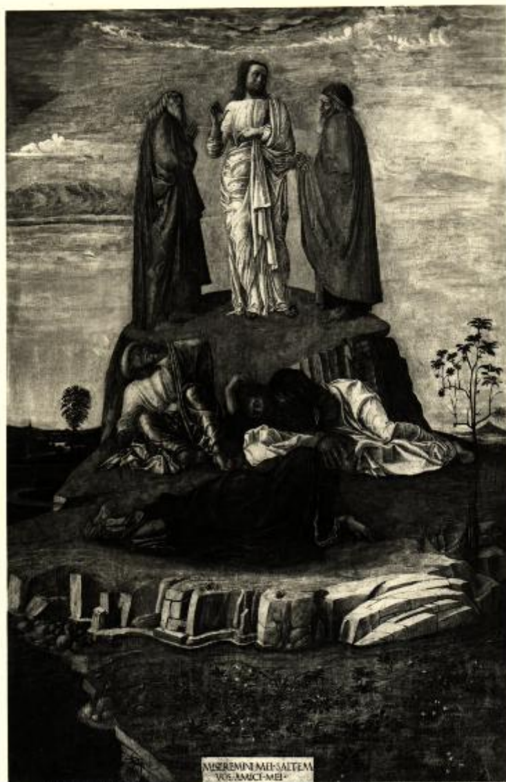
(Ed. Alinari) P. 2. N. 13433. VENEZIA - Museo Civico. La Trasfigurazione sul Monte Tabor. (Giov. Bellini già att. al Mantegna.)