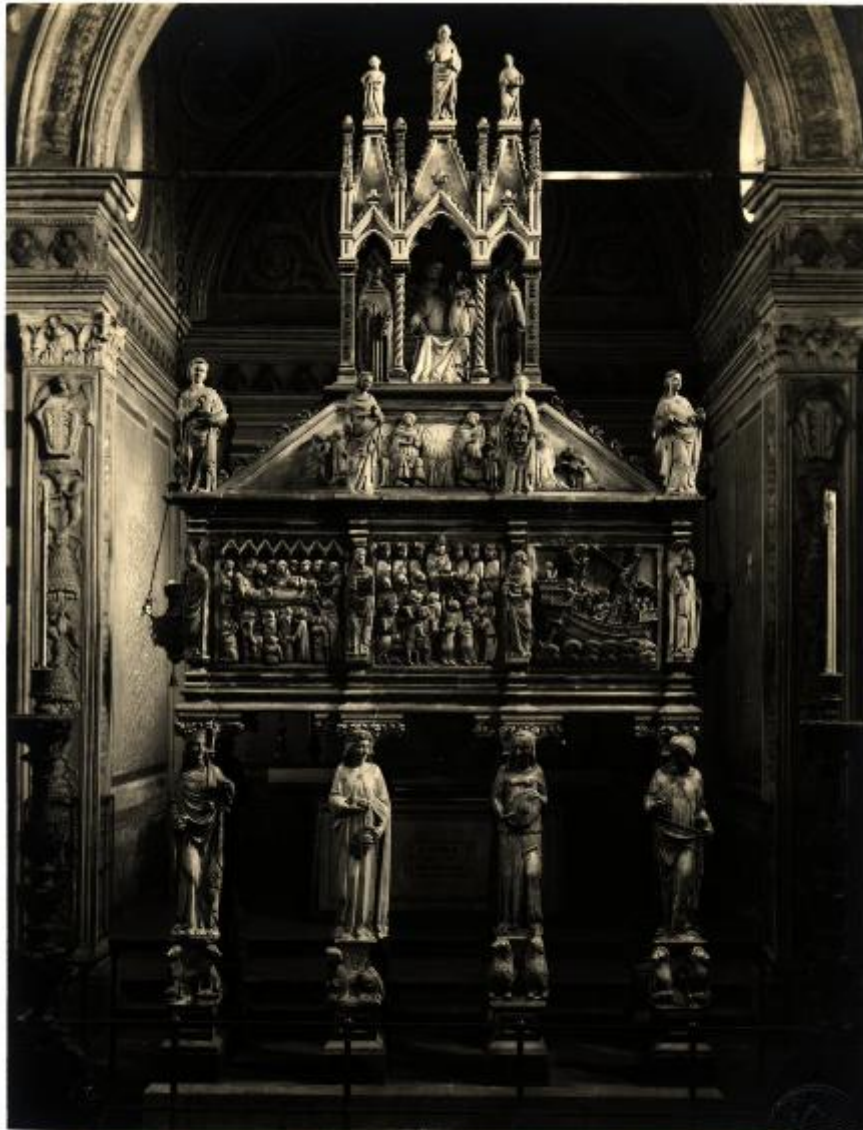
(Ed.: Alinari). P.: L. N.° 14176. MILANO - Basilica di S. Eustorgio. Arca di San Pietro Martire. (Baldaccio da Pisa, 1338.)