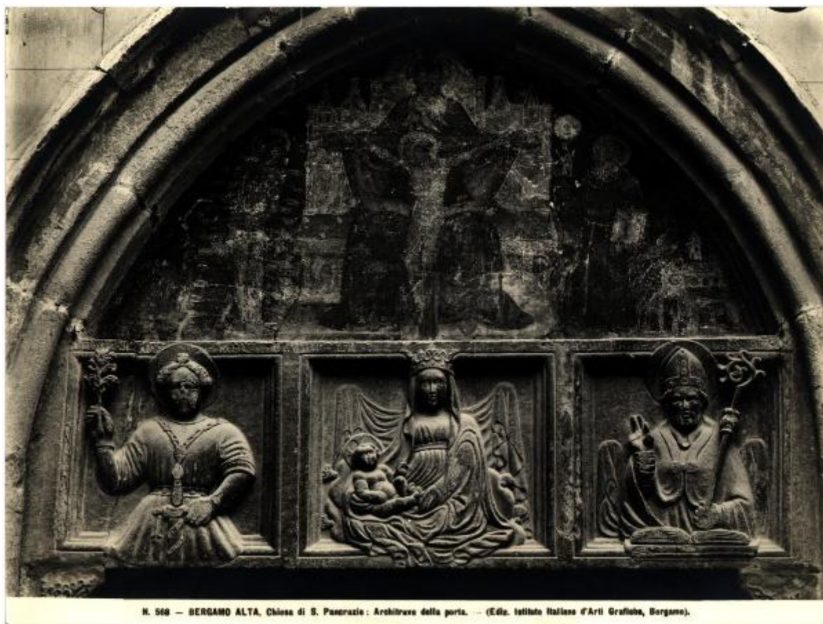
N. 568 — BERGAMO ALTA, Chiesa di S. Pancrazio: Architrave della porta. — (Ediz. Istituto Italiano d'Arti Grafiche, Bergamo).

Link risorsa: https://www.lombardiabeniculturali.it/fotografie/schede/IMM-3a010-0009557/