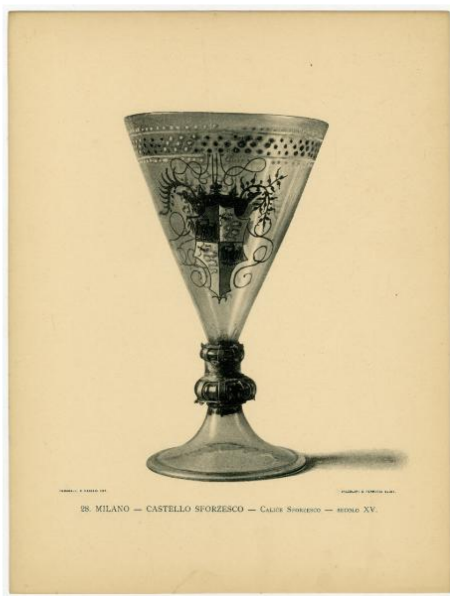
28. MILANO — CASTELLO SFORZESCO — CALICE SFORZESCO — SECOLO XV.