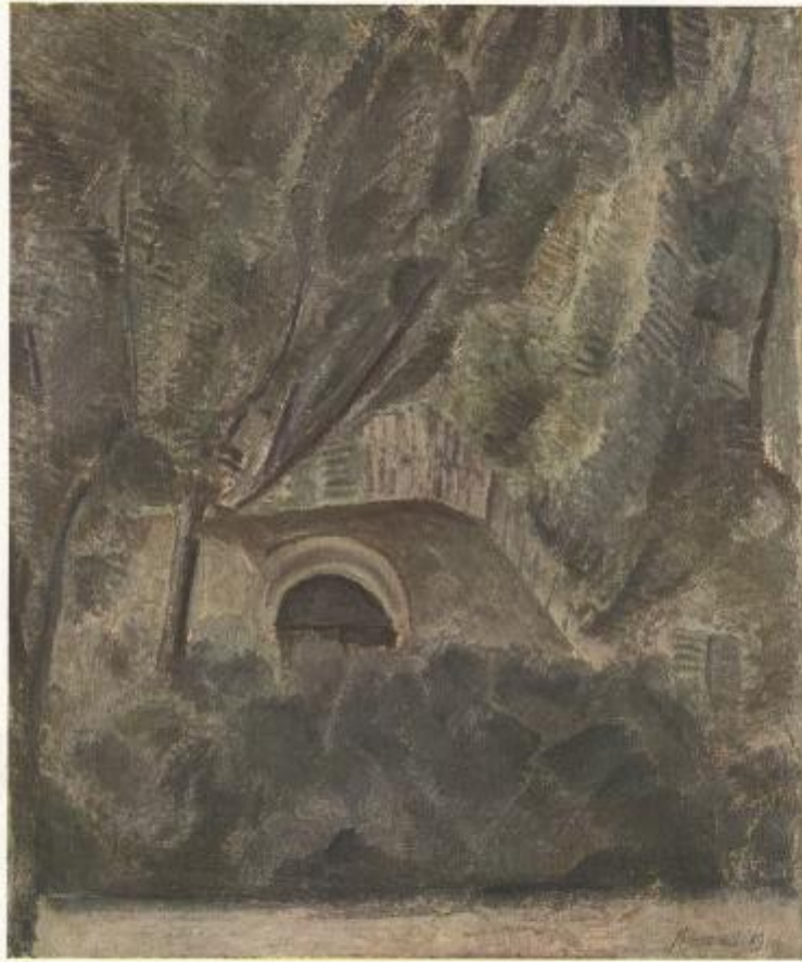
1004 - GIUSEPPE MORANDI Passaggio - olio 40x60 Londrone Lombardi Pagnola

Galleria del Museo Belfiore - Milano, via Sesto, 51 Riviera di San - Comune di Sesto del Milano 1926