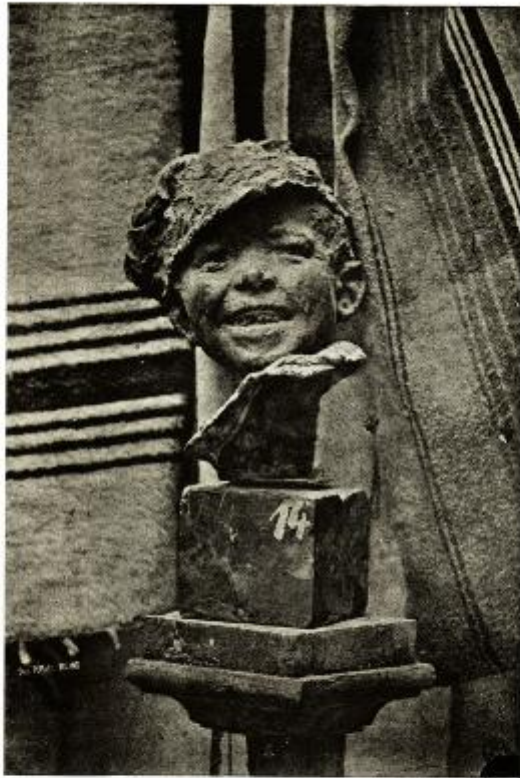
M. BASSO TIF. MILANO, VIA GIUSEPPE GIUSEP, 17.