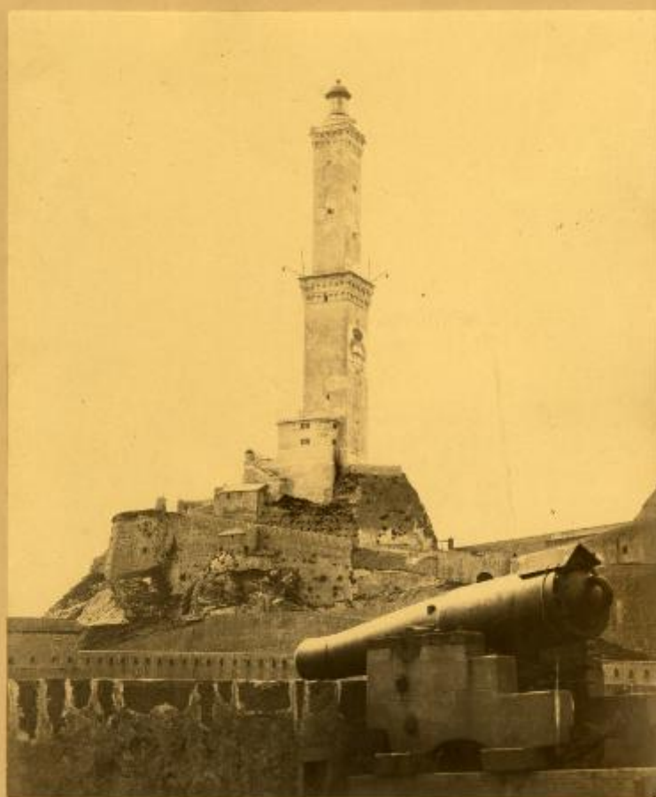
VEDUTE DI GENOVA