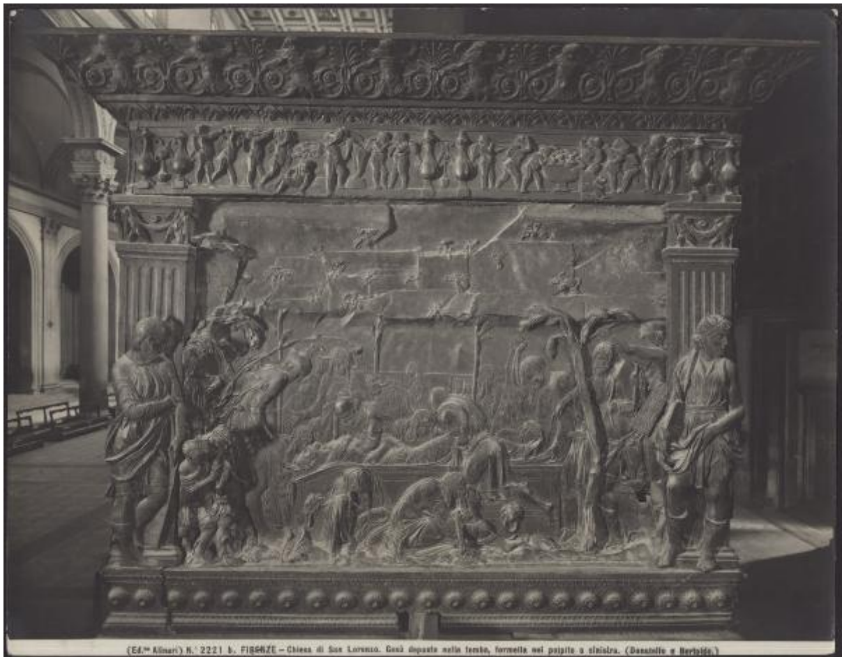
N.° 2221 b. FIGURE – Chiesa di San Lorenzo. Gesù deposto nella tomba, formella nei paggiti a sinistra. (Dacotello e Bertoldo.)