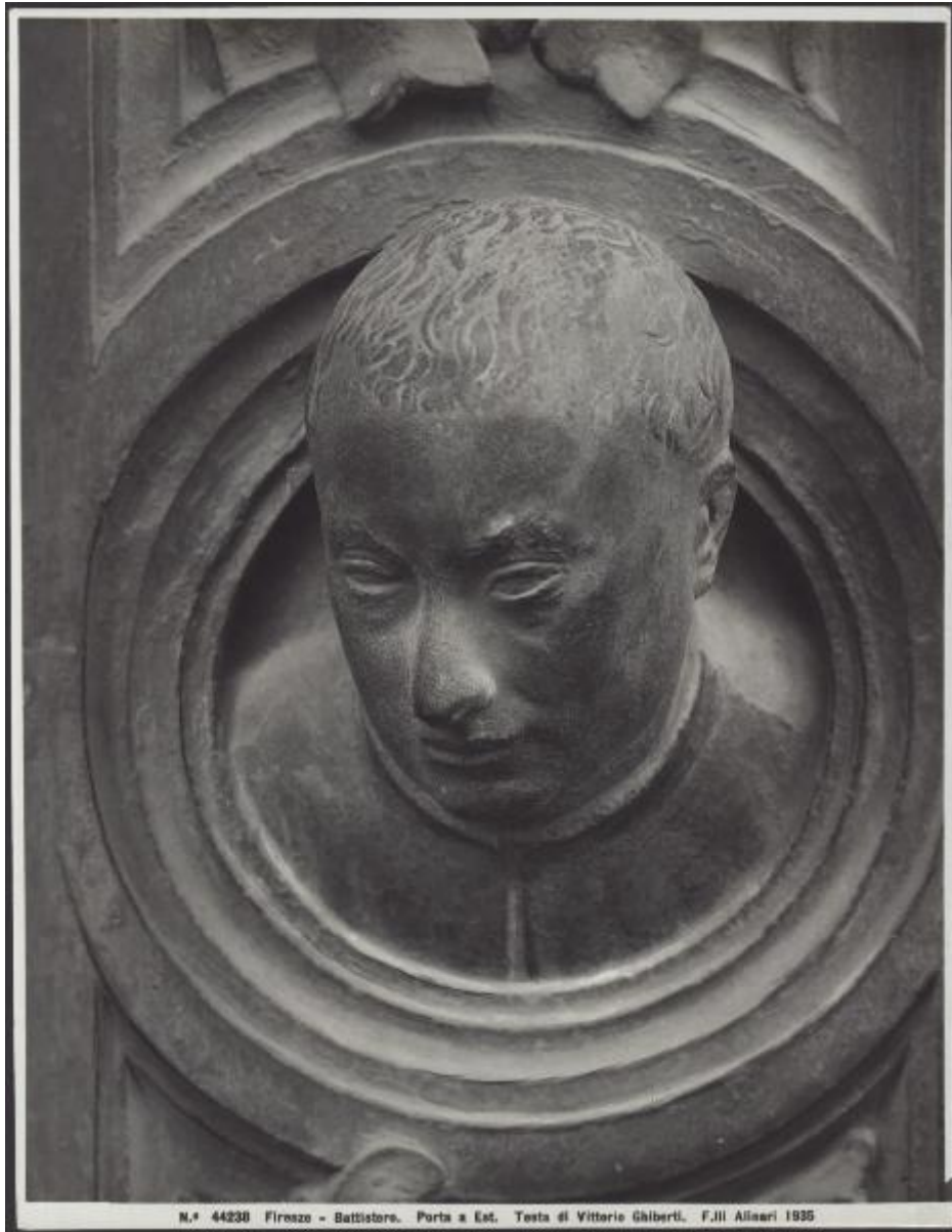
N.° 44230 Firenze - Battistero. Porta a Est. Testa di Vittorio Ghiberti. F.lli Allinari 1935