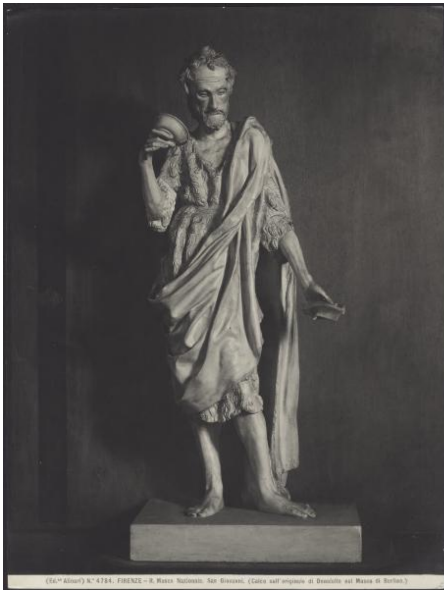
(Ed. "Adlon") N.° 4784. FIRENZE - R. Museo Nazionale. San Giovanni. (Calco sull'originale di Donatello nel Museo di Berlino.)