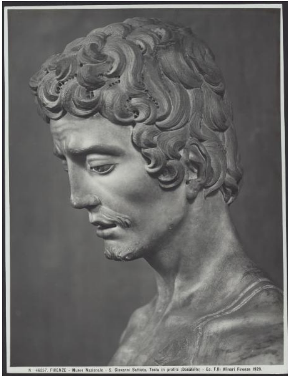
N. 46257. FIRENZE - Museo Nazionale - S. Giovanni Battista, Testa in profilo (Basaltello)