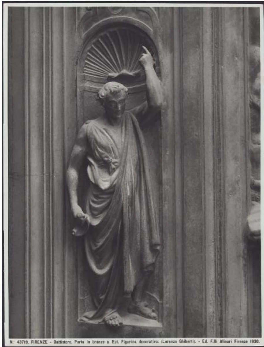
N. 43719. FIRENZE - Battistero. Porta in bronzo a Est. Figurina decorativa. (Lorenzo Ghiberti). - Ed. F.lli Alinari Firenze 1930.