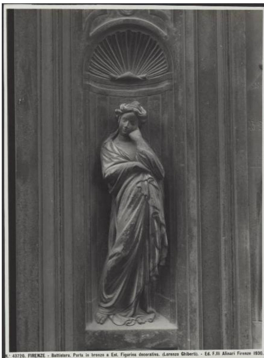
43720. FIRENZE - Battistero. Porta in bronzo a Est. Figurina decorativa. (Lorenzo Ghiberti). - Ed. F.lli Alinari Firenze 1930.