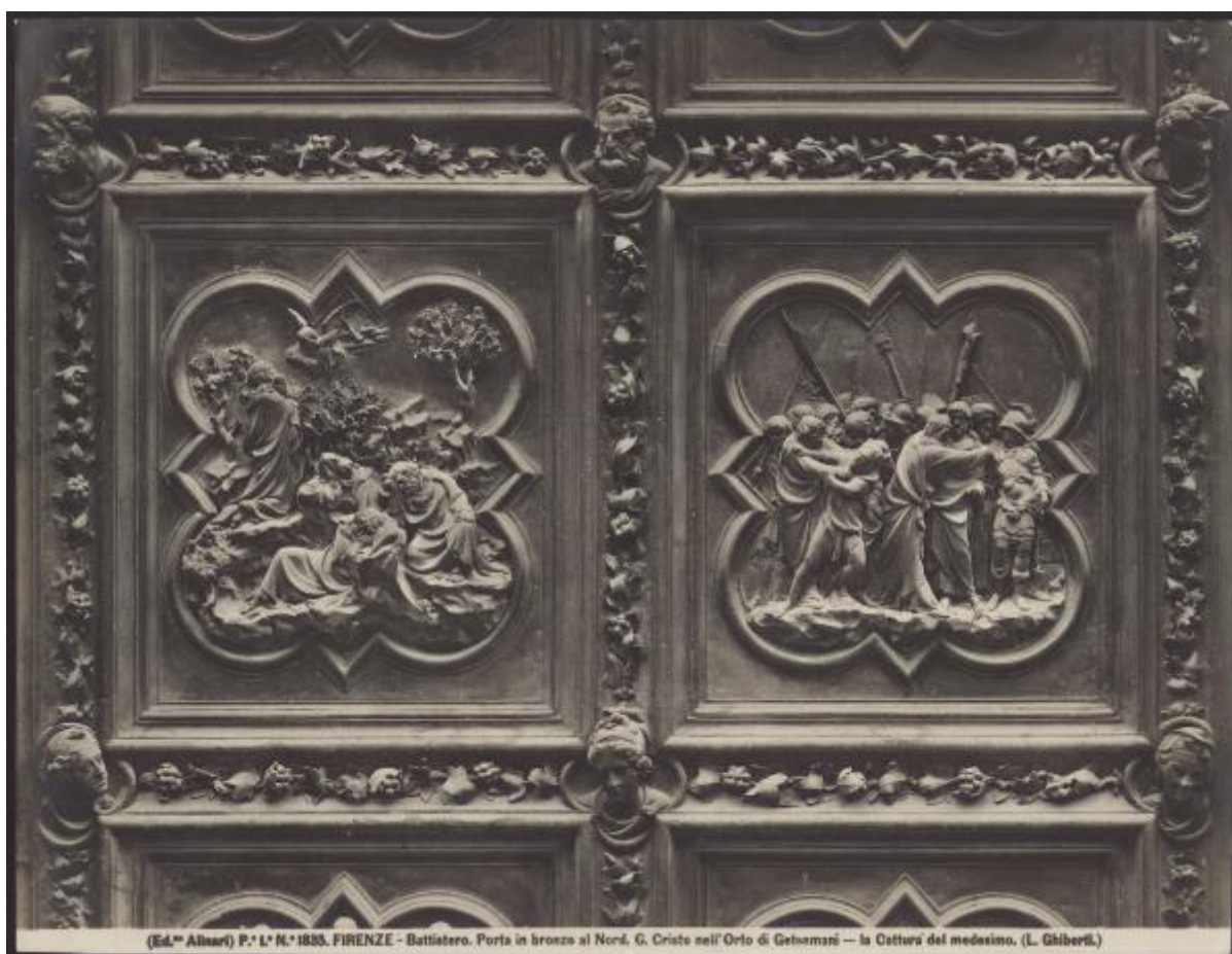
(Ed.ª Alinari) P. L. N.º 1835. FIRENZE - Battistero. Porta in bronzo al Nord, G. Cristo nell'Orto di Getsemani — la Cattura del medesimo. (L. Ghiberti.)