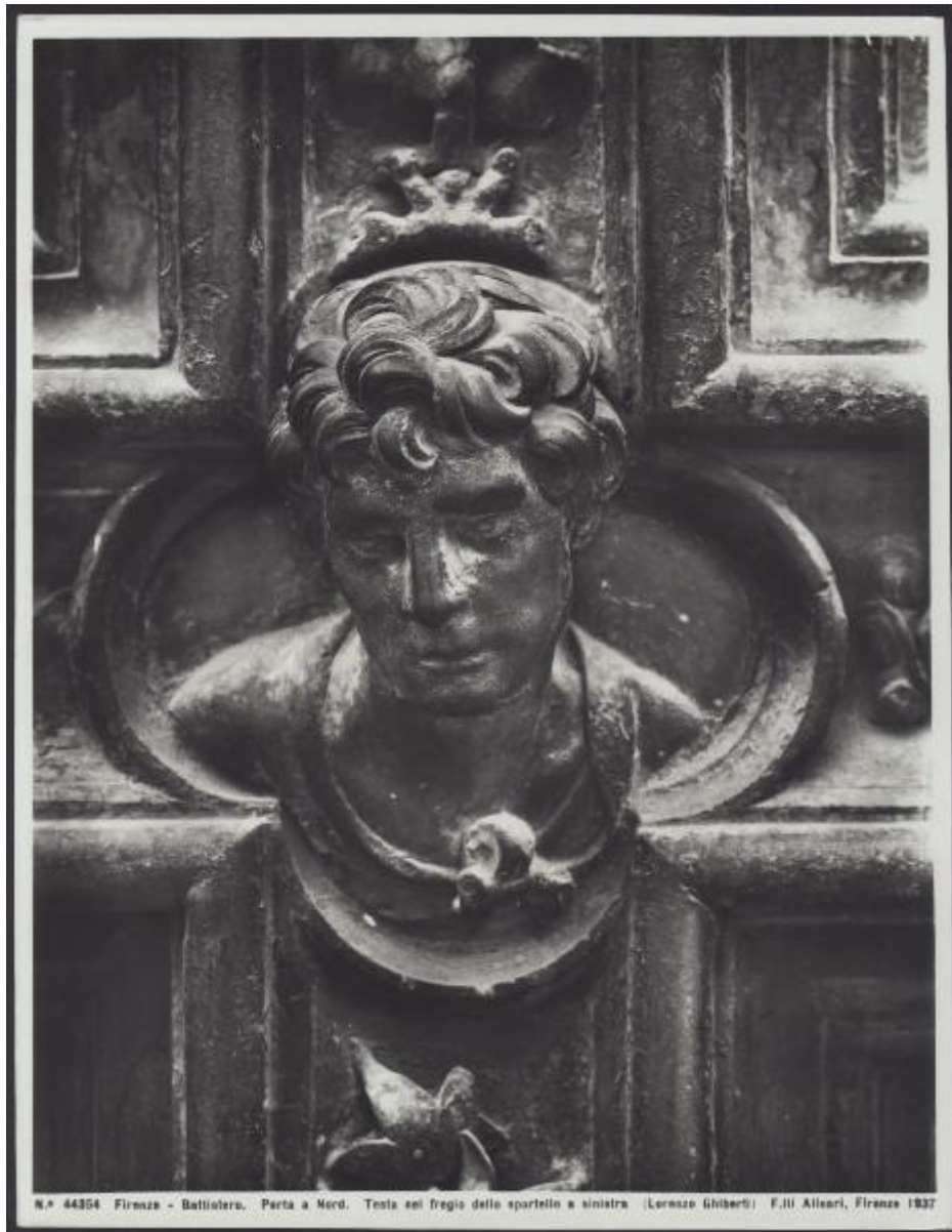
N.° 44354 Firenze - Battistero. Porta a Nord. Testa nel fregio dello sportello a sinistra (Lorenzo Ghiberti) F.lli Alessari, Firenze 1937