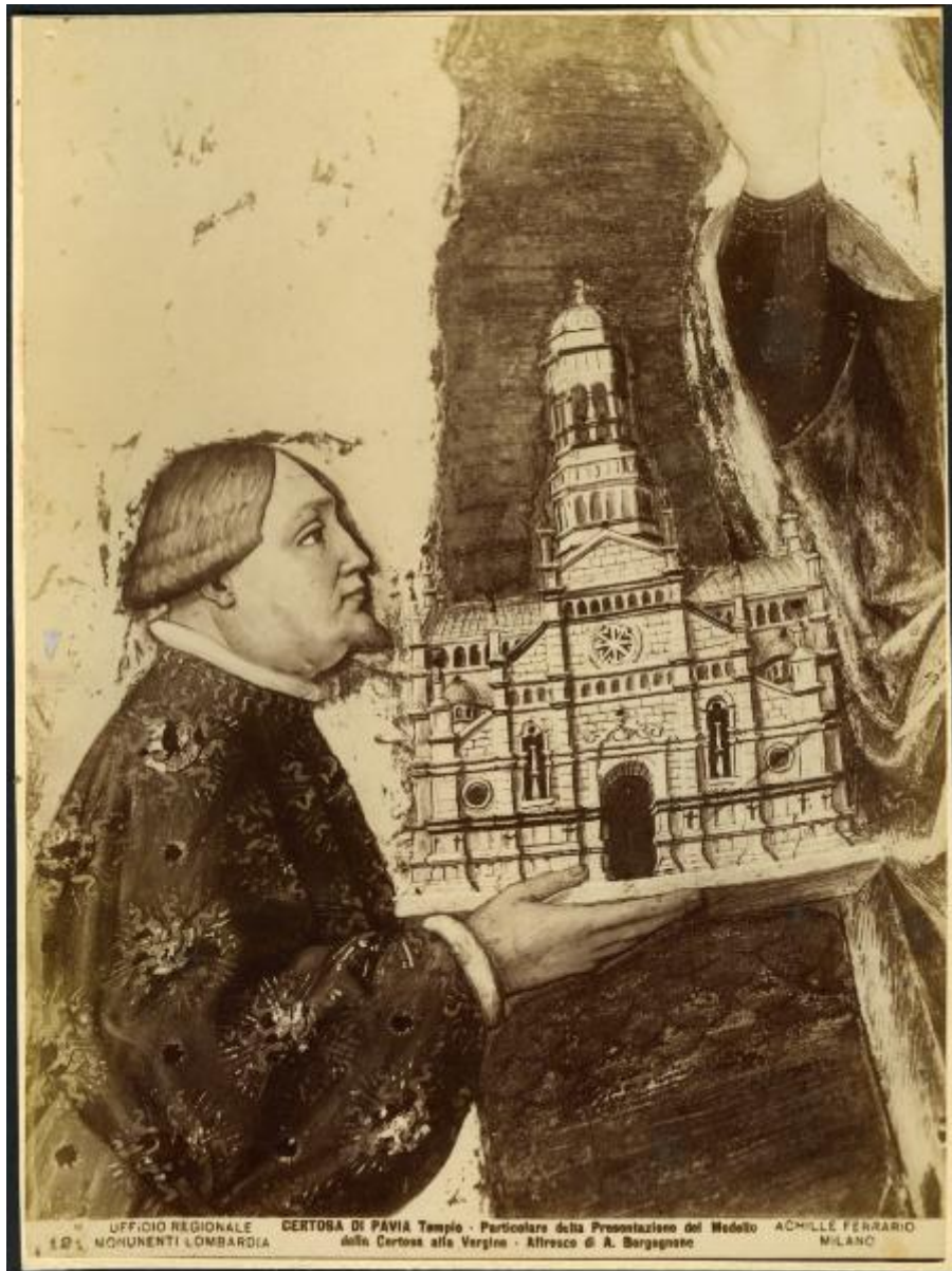
UFFICIO REGIONALE MONUMENTI LOMBARDA CERTOSA DI PAVIA Tempio - Particolare della Presentazione del Modello della Certosa alla Vergine - Affresco di A. Borgognato ACHILLE FERRARIO MILANO