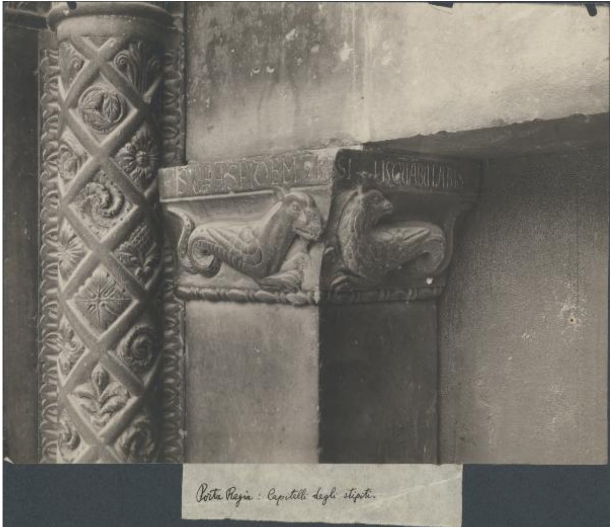
Porta Pagine : Capitelli degli stipiti.