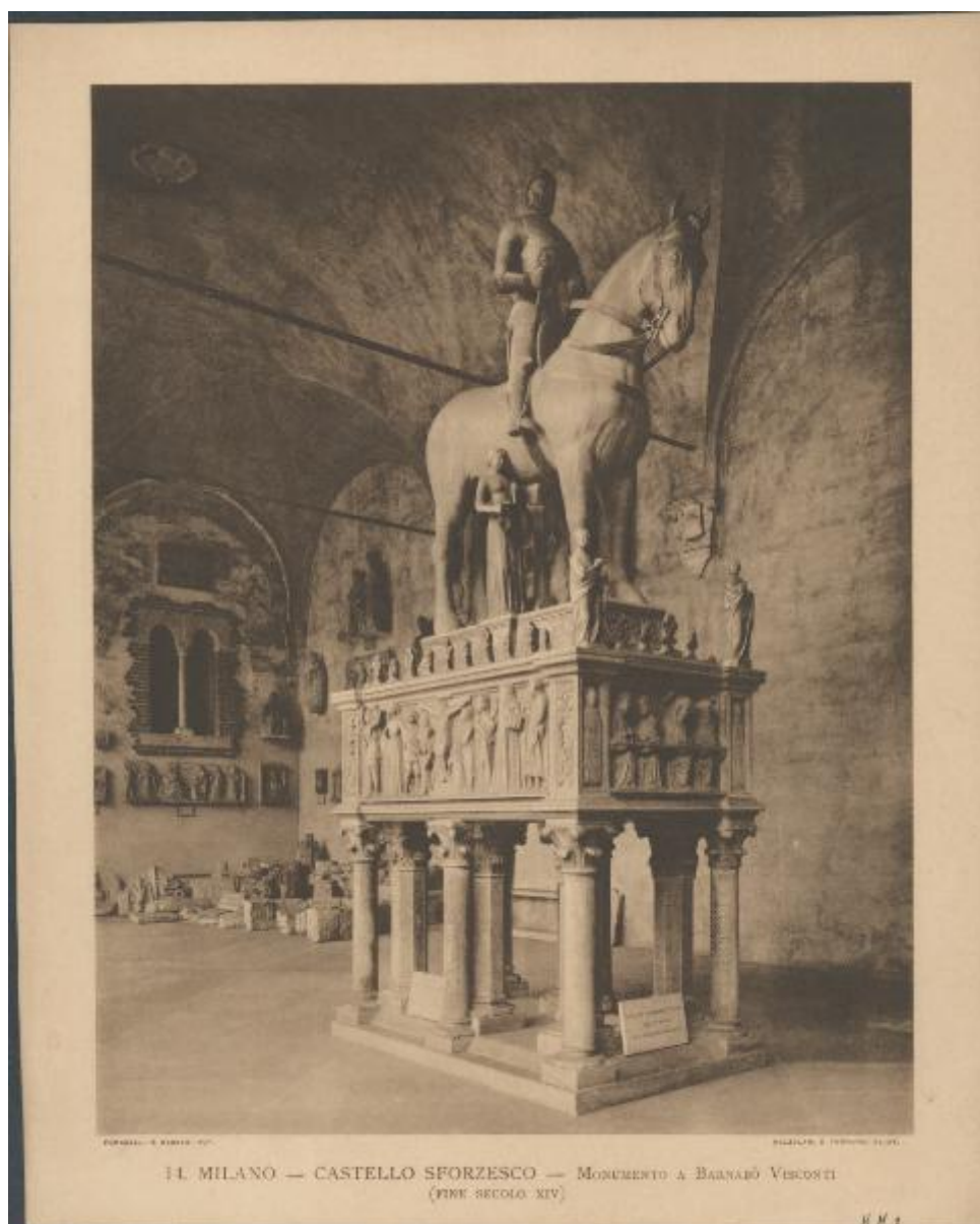
14. MILANO — CASTELLO SFORZESCO — MONUMENTO A BERNABÒ VISCONTI (FINE SECOLO XIV)