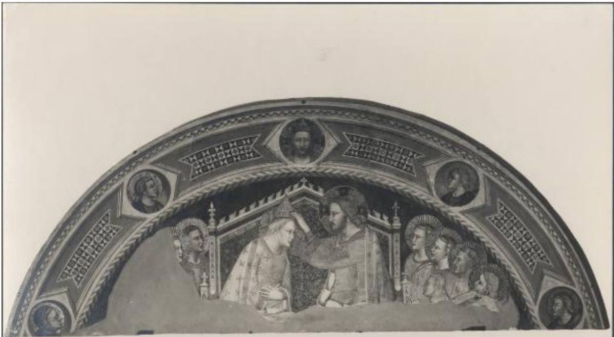
№ 44615 Firenze - Museo dell'Opera del Duomo. Coronazione della Vergine. (Fram. di affresco attrib. a Maso di Banco) F.lli Alfani, Firenze 1887