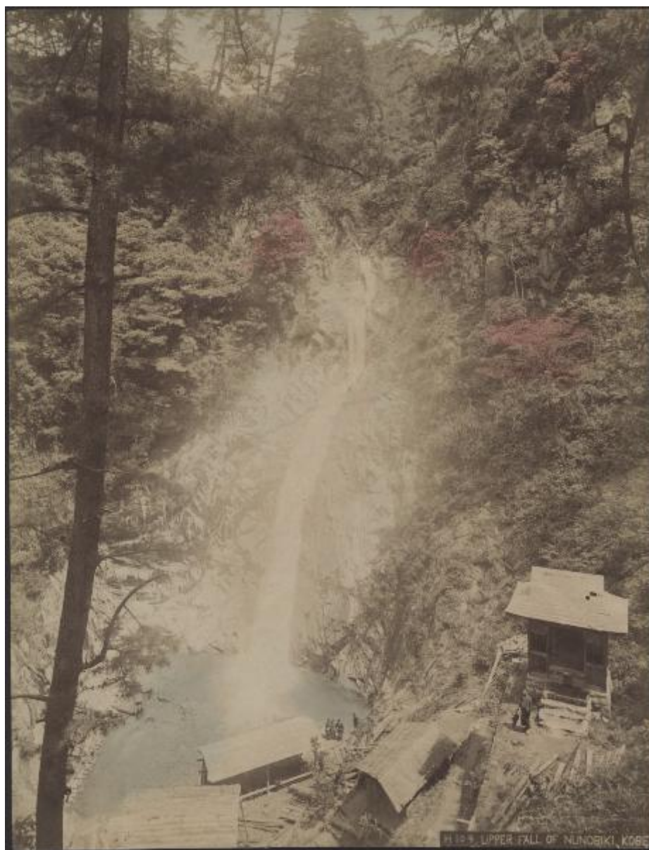
11.10.13 UPPER FALL OF NUNOBIKI, KOBE.