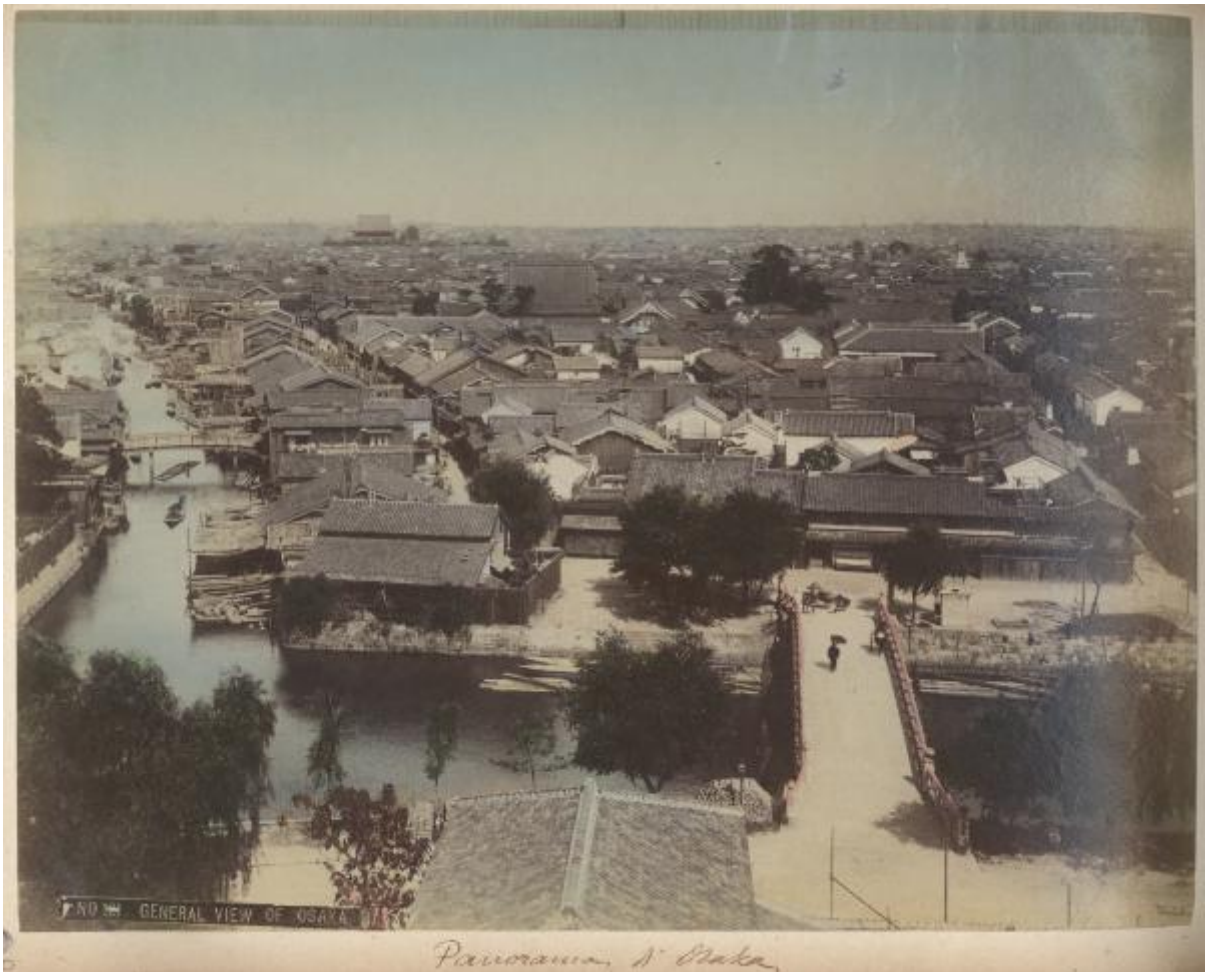
NO GENERAL VIEW OF OSAKA