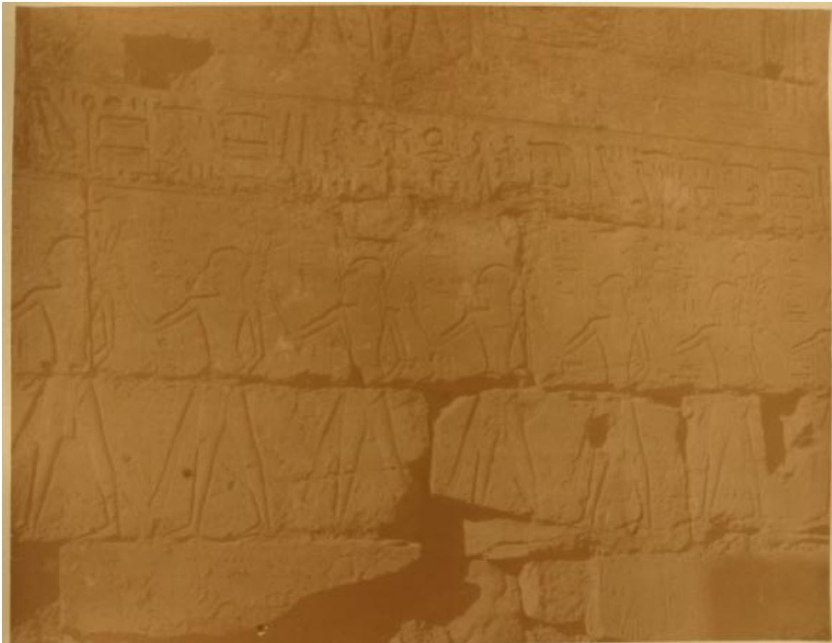
Lo scarabeo - I figli di Ramses (basilico nel tempio).