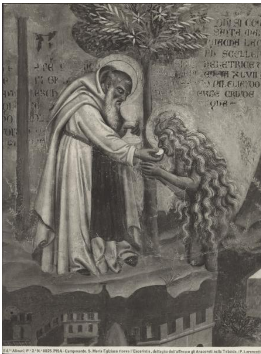
P. 2. N. 3825. PISA - Camposanto. S. Maria Egiziaca riceve l'Esorcista, dettaglio dell'affresco gli Anacoreti nella Tebaide. (P. Lorenzetti).