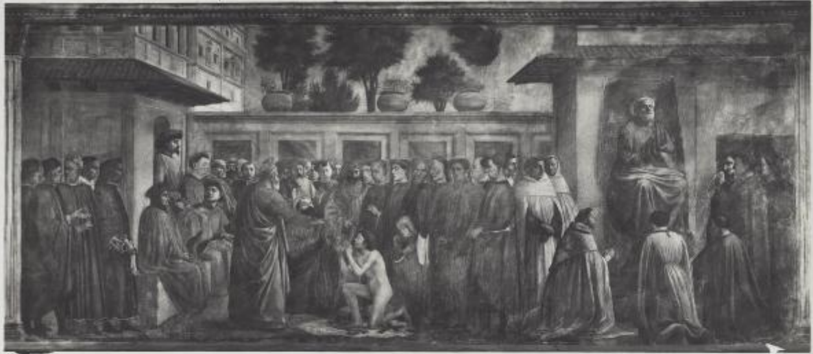
P. 2.° N. 3850. FIRENZE - Chiesa del Carmine, Cappella Brancacci, S. Pietro in Cattedra e il miracolo del fanciullo resuscitato - Masaccio e Filippo Lippi.