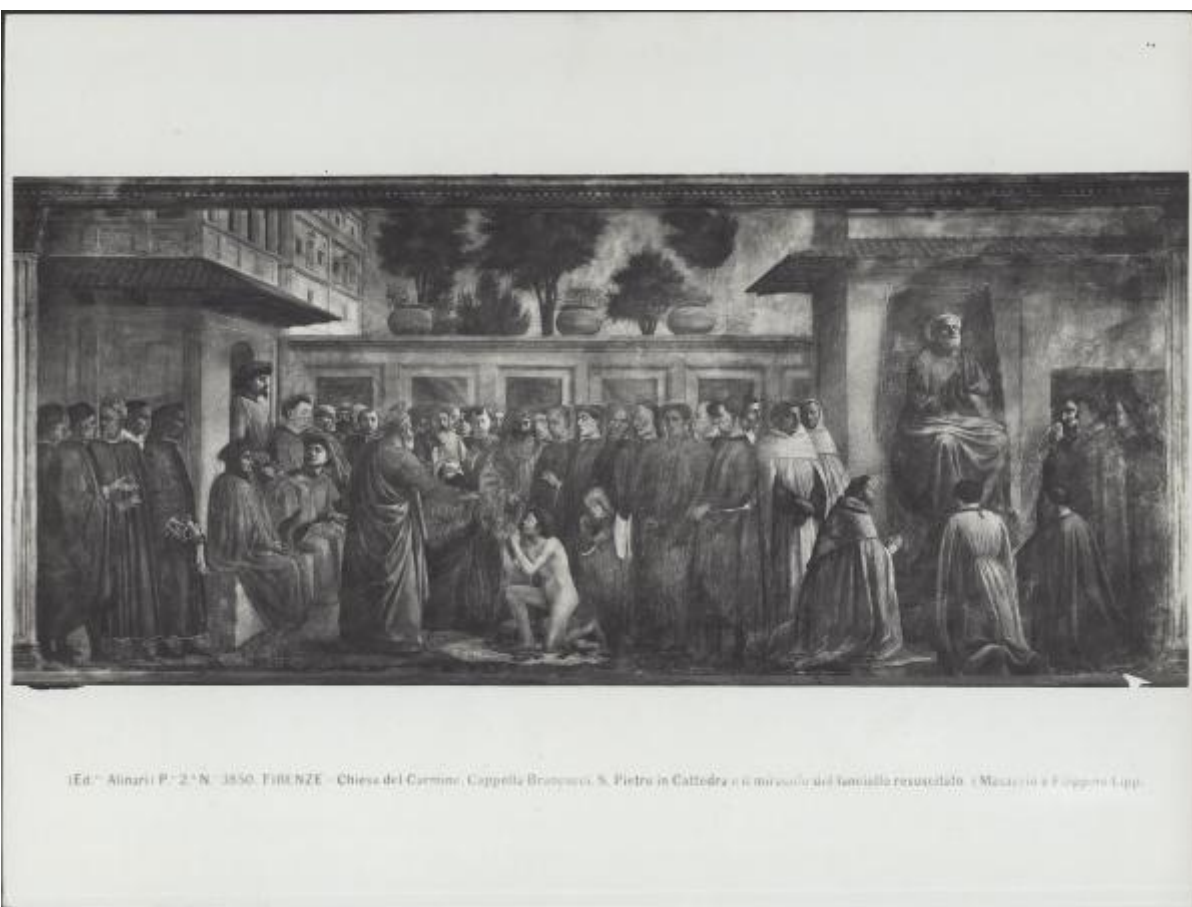
P. 2.° N. 3850. FIRENZE - Chiesa del Carmine, Cappella Brancacci, S. Pietro in Cattedra e il miracolo del fanciullo resuscitato - Masaccio e Filippo Lippi.