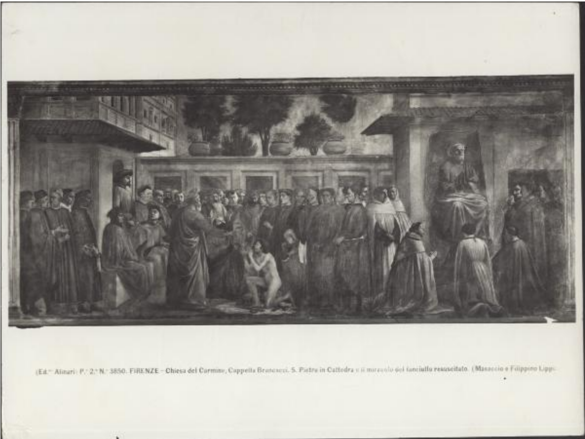
FIRENZE - Chiesa del Carmine, Cappella Brancacci. S. Pietra in Cattedra e il miracolo del fanciullo resuscitato. (Masaccio e Filippino Lippi)