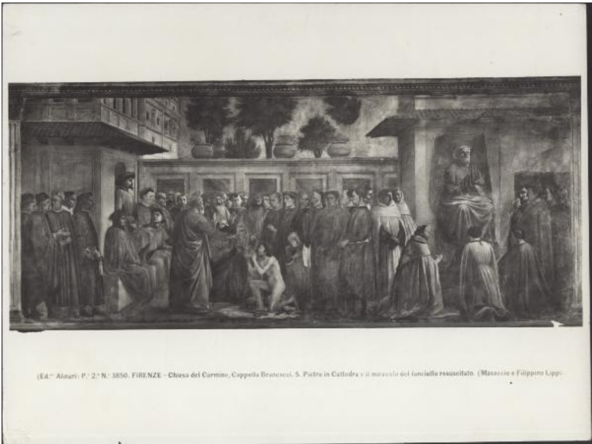
FIRENZE - Chiesa del Carmine, Cappella Brancacci. S. Pietra in Catidra e il miracolo del fanciullo resuscitato. (Masaccio e Filippino Lippi)