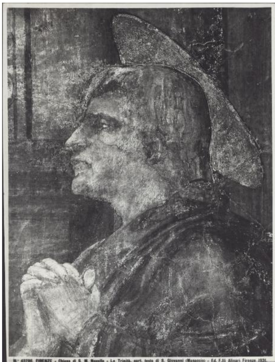
N.° 43796. FIRENZE - Chiesa di S. M. Novella - La Trinità, part. testa di S. Giovanni (Masaccio) - Ed. F.lli Alinari Firenze 1931.