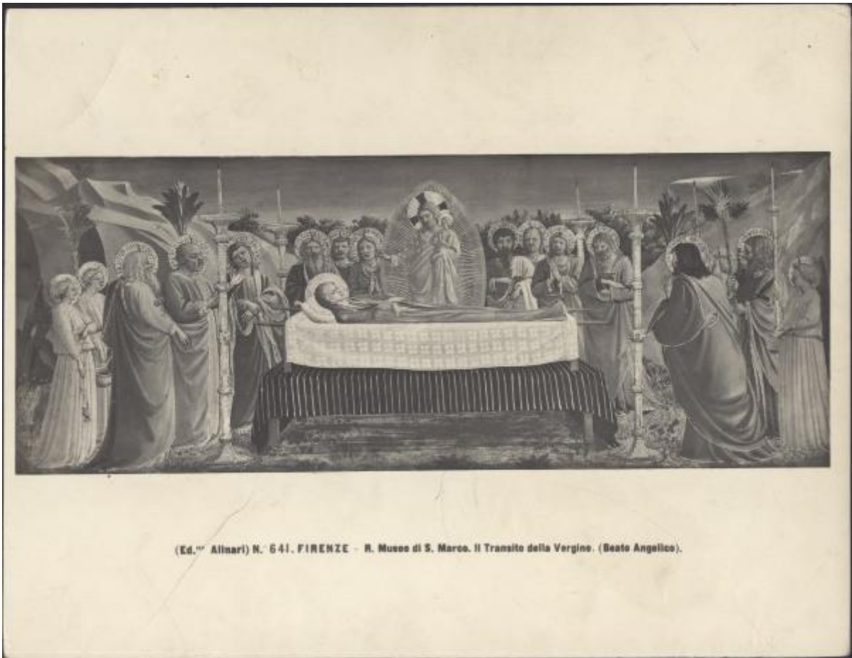
(Ed. "Alinari" N. 641. FIRENZE - R. Museo di S. Marco. Il Transito della Vergine. (Beato Angelico).

Link risorsa: https://www.lombardiabeniculturali.it/fotografie/schede/IMM-3a050-0003392/