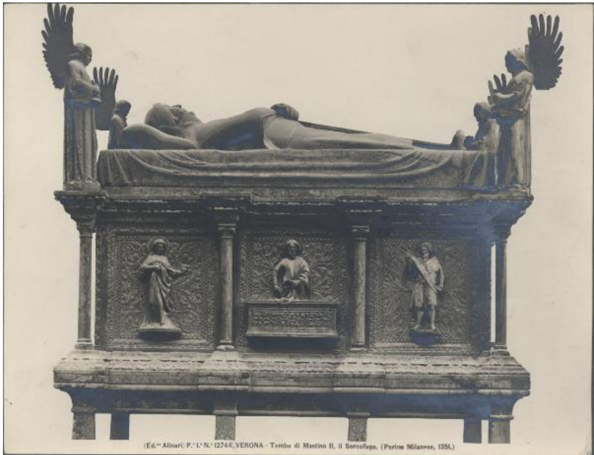
(P. I. N. 12744, VERONA - Tomba di Mastino II, il Sarcofago, (Perino Milanese, 1354.)